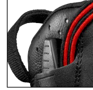
HAIX® Klima Sistemi