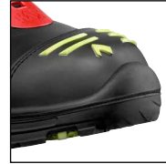
HAIX® Yüksek Dayanımlı Burun Sistemi