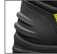
Bot çıkarma desteği