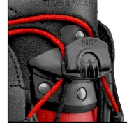
HAIX® Hızlı Bağcık Sistemi