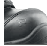
HAIX® Kompozit burun