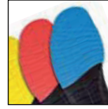
Vario Geniş Fit Sistemi